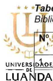
Tabela 23. Grau de Cumprimento das actividades planeadas para 2024, na Biblioteca Central - Dezembro de 2024